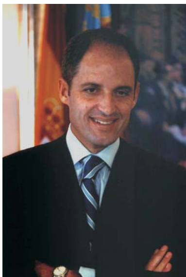
Francisco Camps Ortiz President de la Generalitat Valenciana

Valencia acoge la celebración del X Congreso Internacional de Ingeniería de Proyectos y abre sus puertas de par en par a los participantes en este gran encuentro.